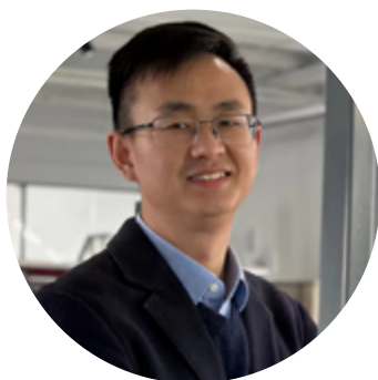
YU SKY Sales Manager

« Lectra me donne l'opportunité de proposer une multitude de solutions à nos clients (salle de coupe, Fashion On Demand, Kubix Link, Flex Offer...). J'apprends beaucoup de toutes ces expériences.